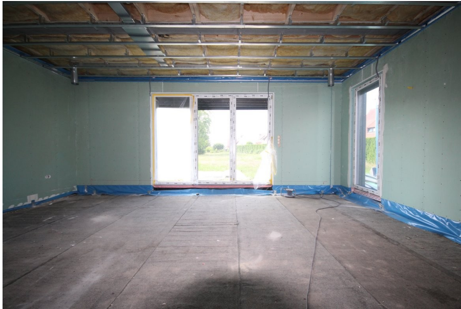
Wohnbereich mit Zugang zur Terrasse