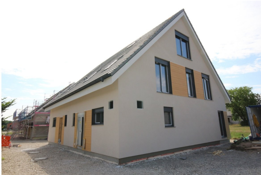
Außensicht - Hauseingang