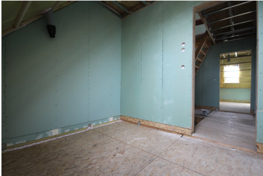
Badezimmer Ansicht 2