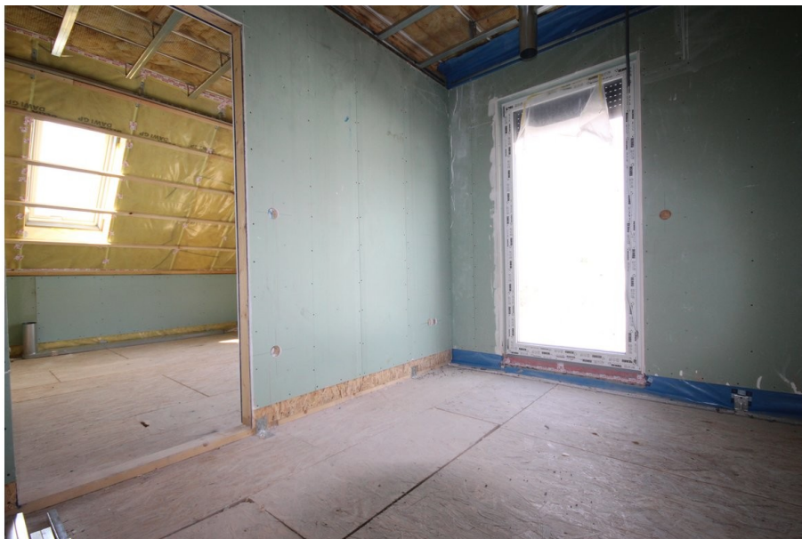
Ankleideraum mit Blick aufs Schlafzimmer