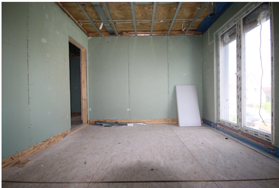
Kinderzimmer 1 - Ansicht 2