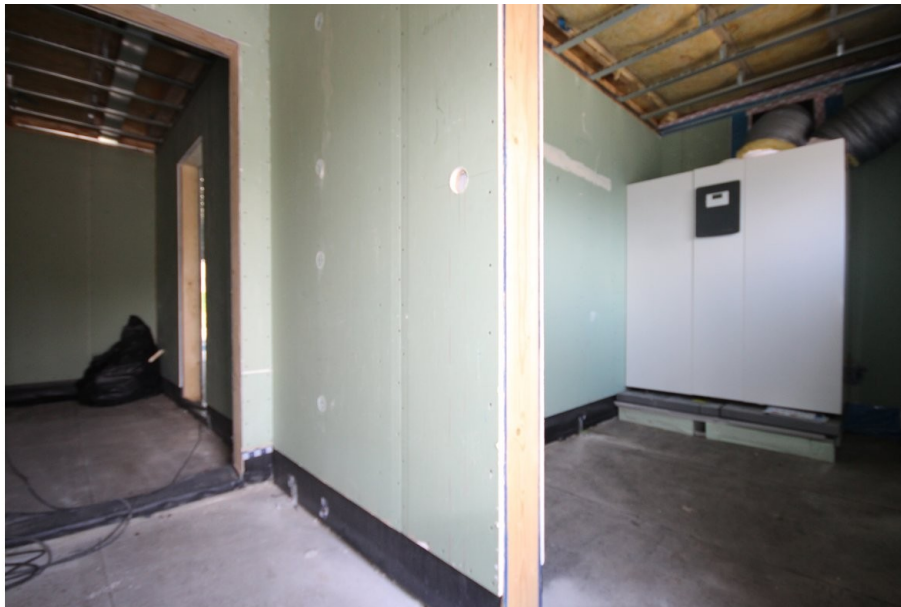
Flur und Technikraum