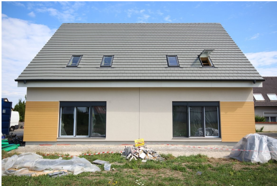
Hausansicht mit Gartenbereich