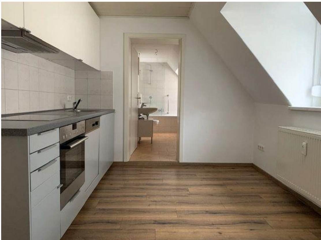
Wohneinheit im Haus