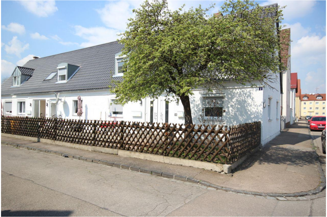
Eingangsbereich Ansicht 2