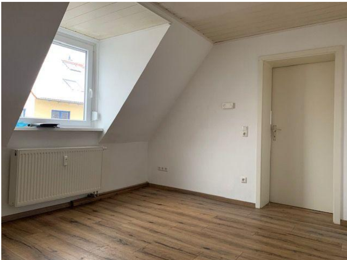
Wohneinheit im Haus