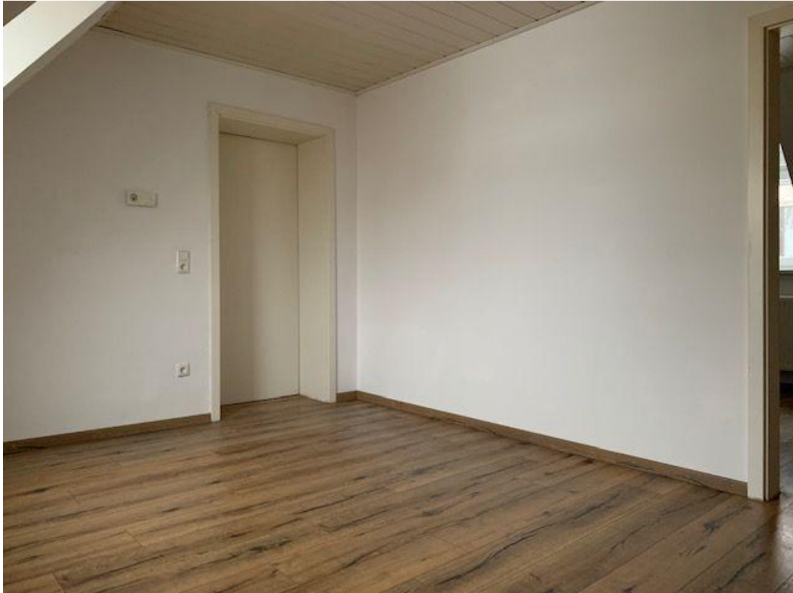
Wohneinheit im Haus