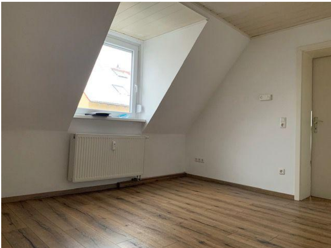
Wohneinheit im Haus