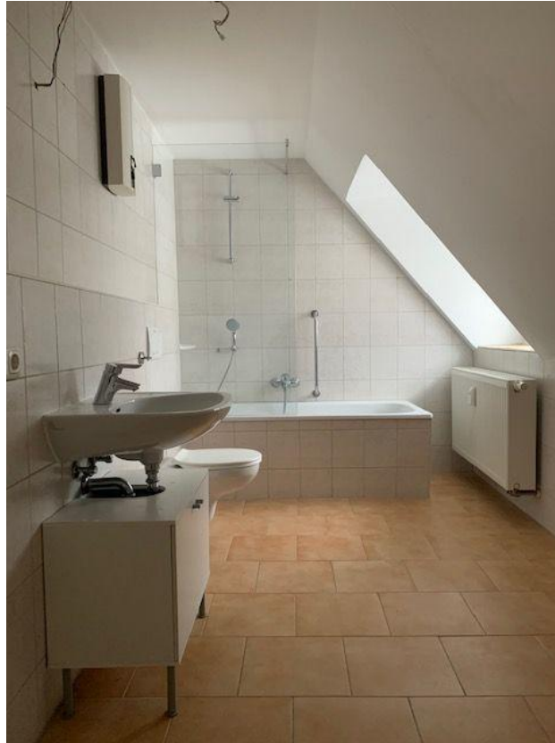
Wohneinheit im Haus