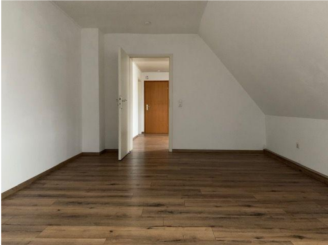
Wohneinheit im Haus