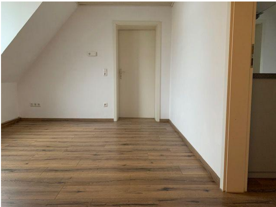
Wohneinheit im Haus