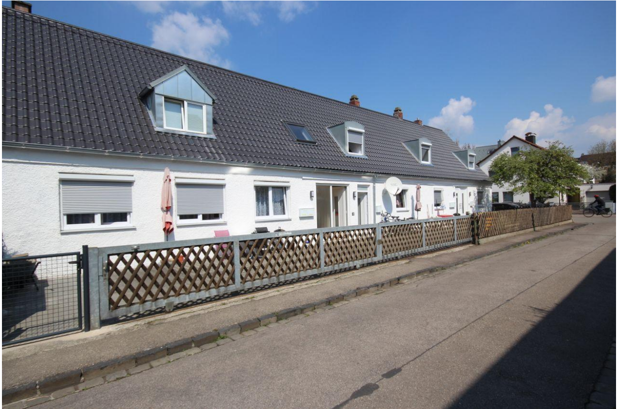
Eingangsbereiche mit Straße