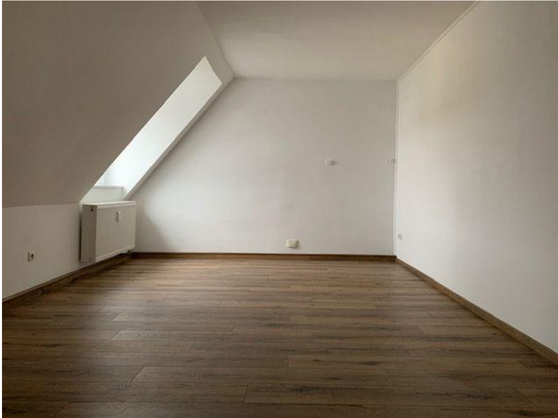
Wohneinheit im Haus