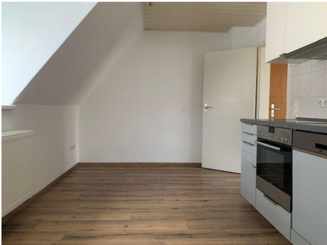
Wohneinheit im Haus