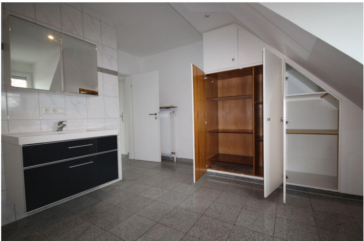
Wohnung im DG