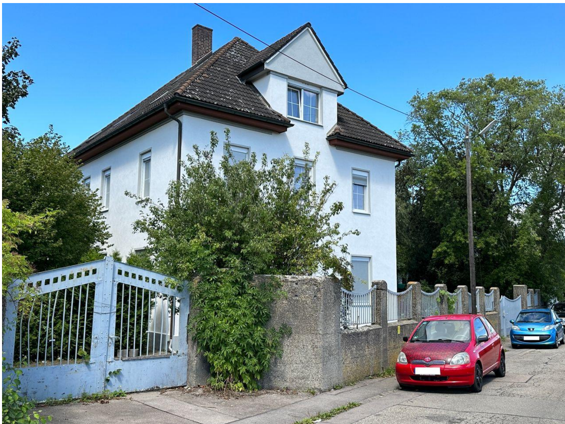
Außenansicht des Wohngebäudes und Straße