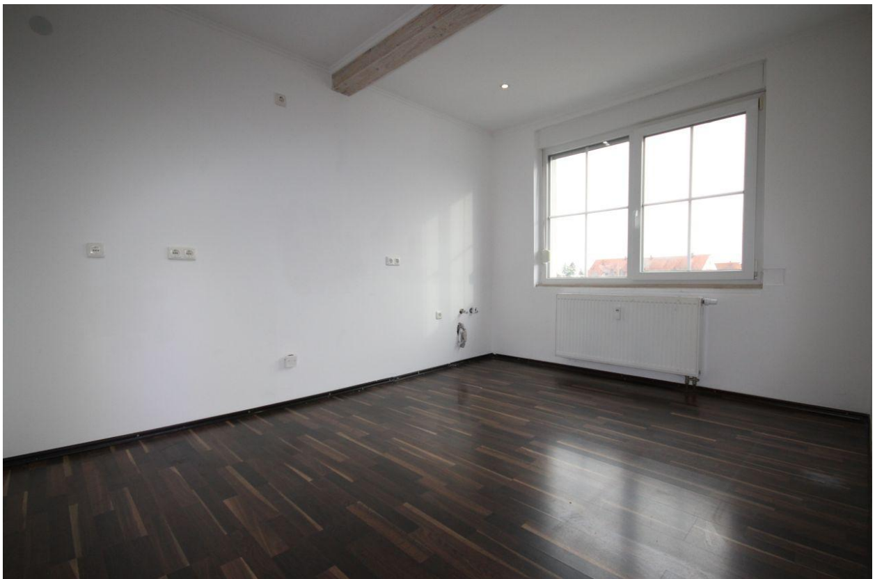
Wohnung im DG (Küche)