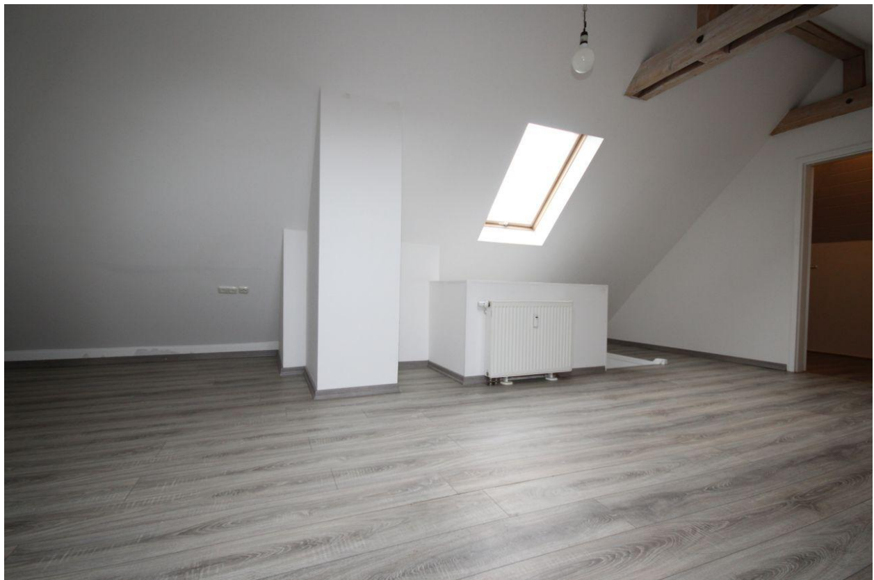
Wohnung im DG