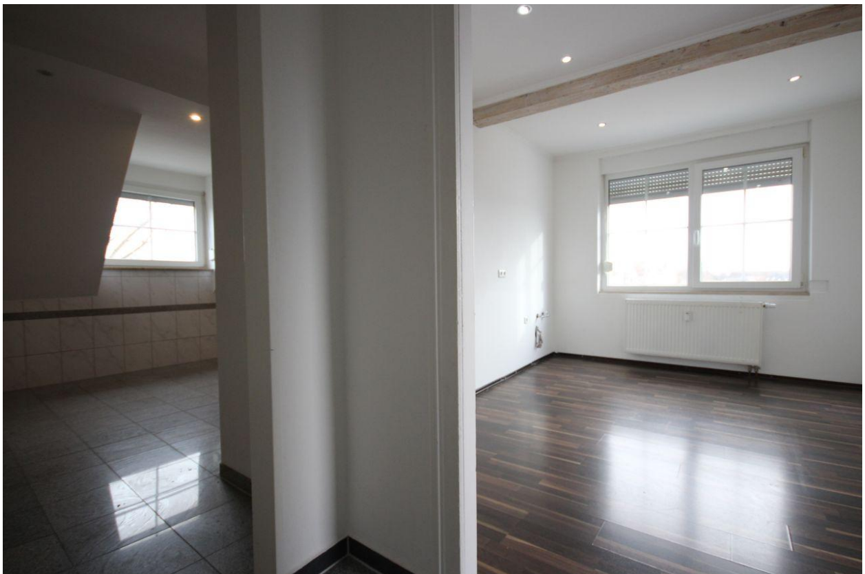
Wohnung im DG