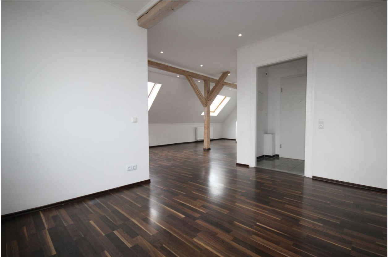
Wohnung im DG