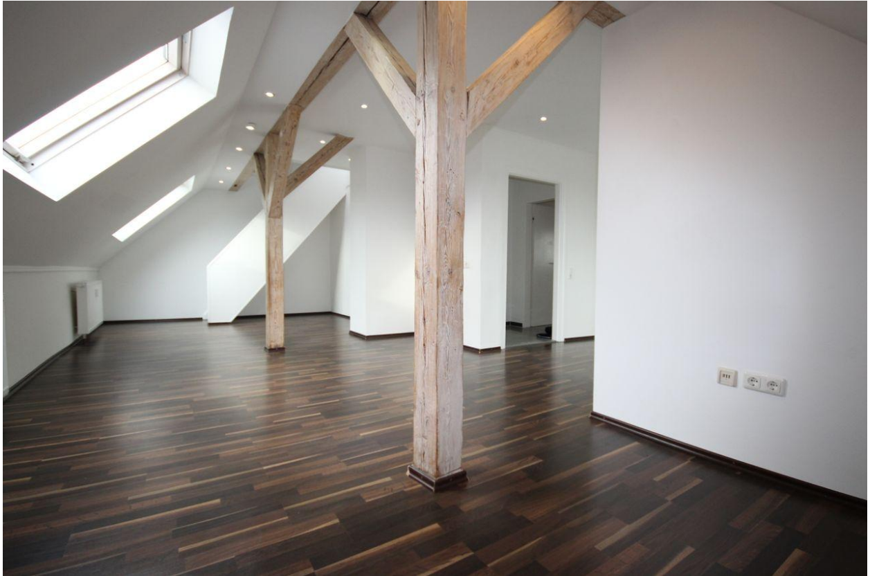
Wohnung im DG