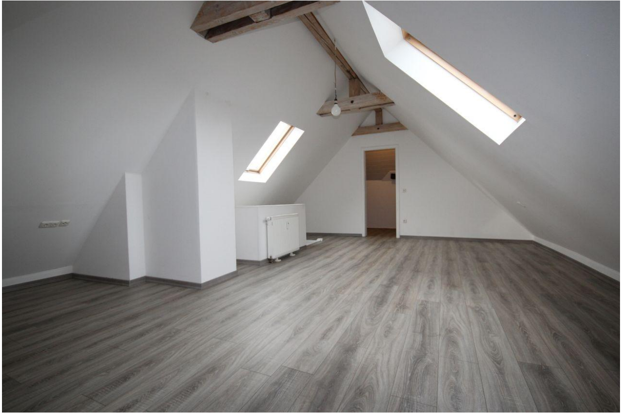
Wohnung im DG