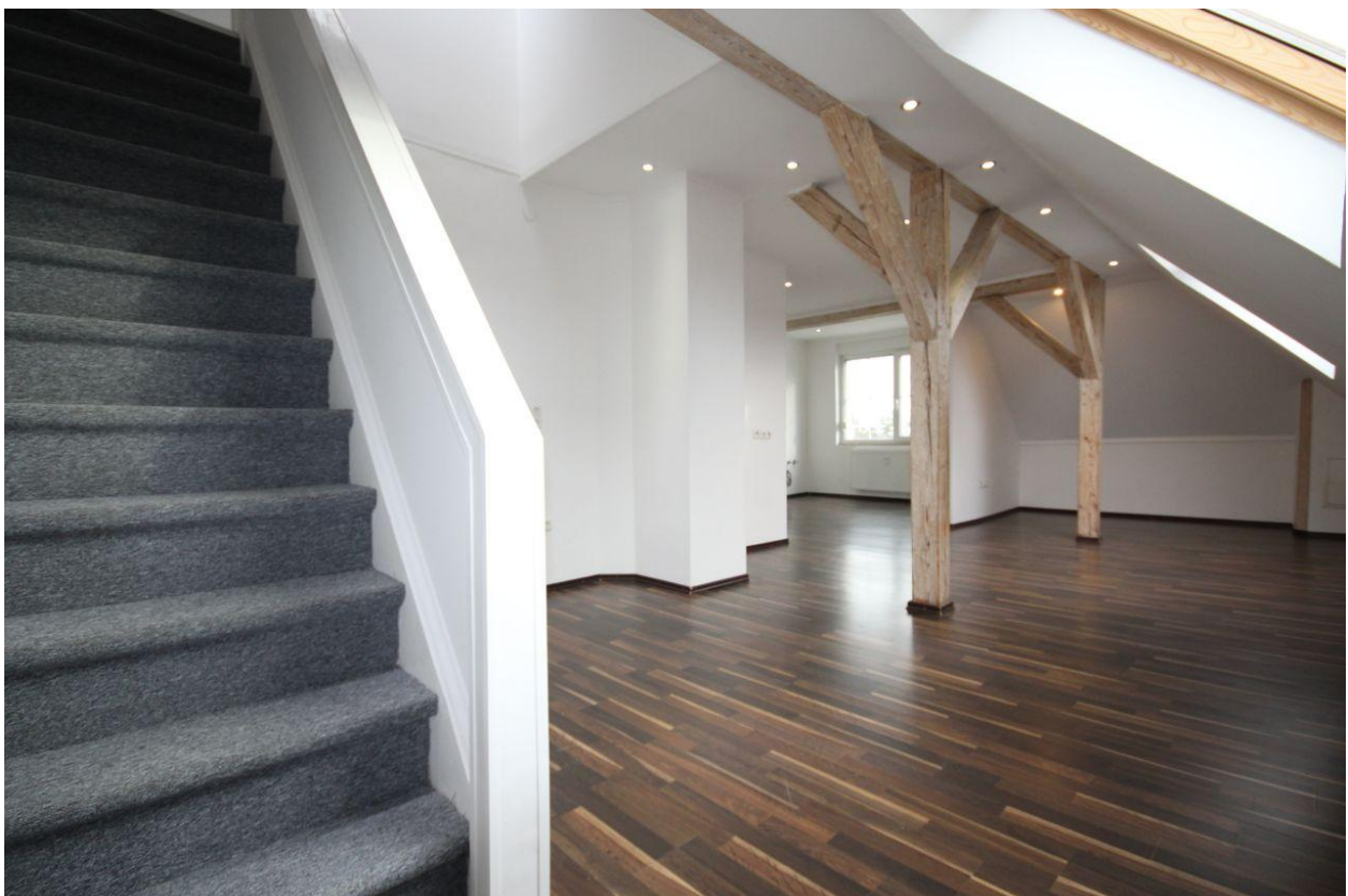
Wohnung im DG