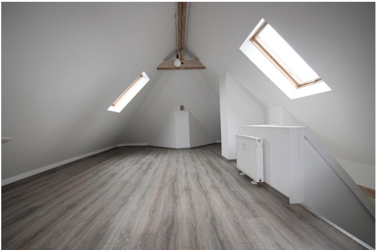
Wohnung im DG (Maisonette)