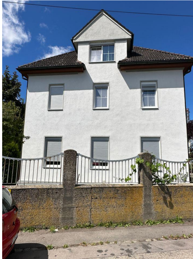
Außenansicht des Wohngebäudes