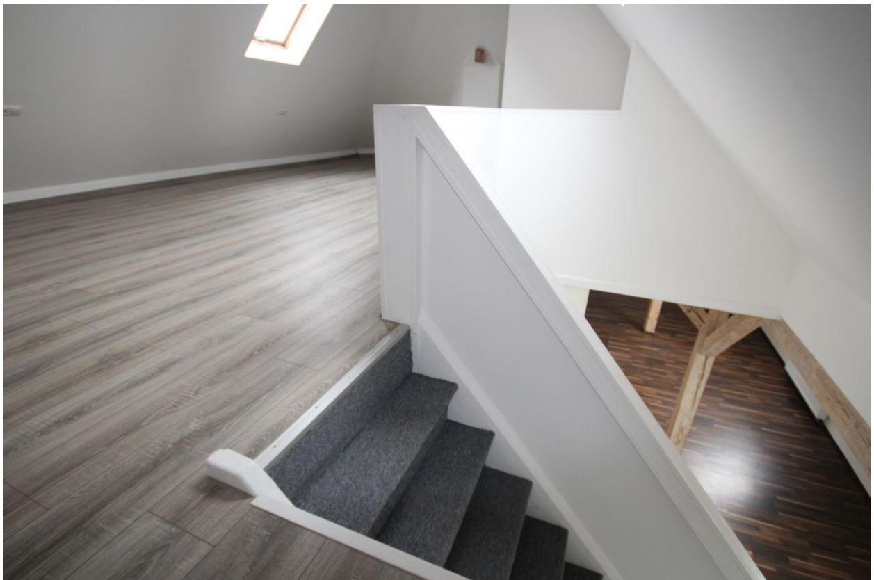
Wohnung im DG