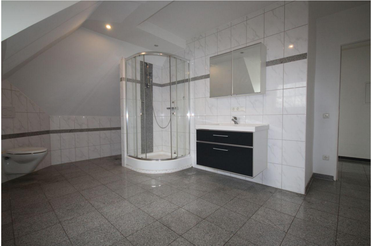
Wohnung im DG (Bad)