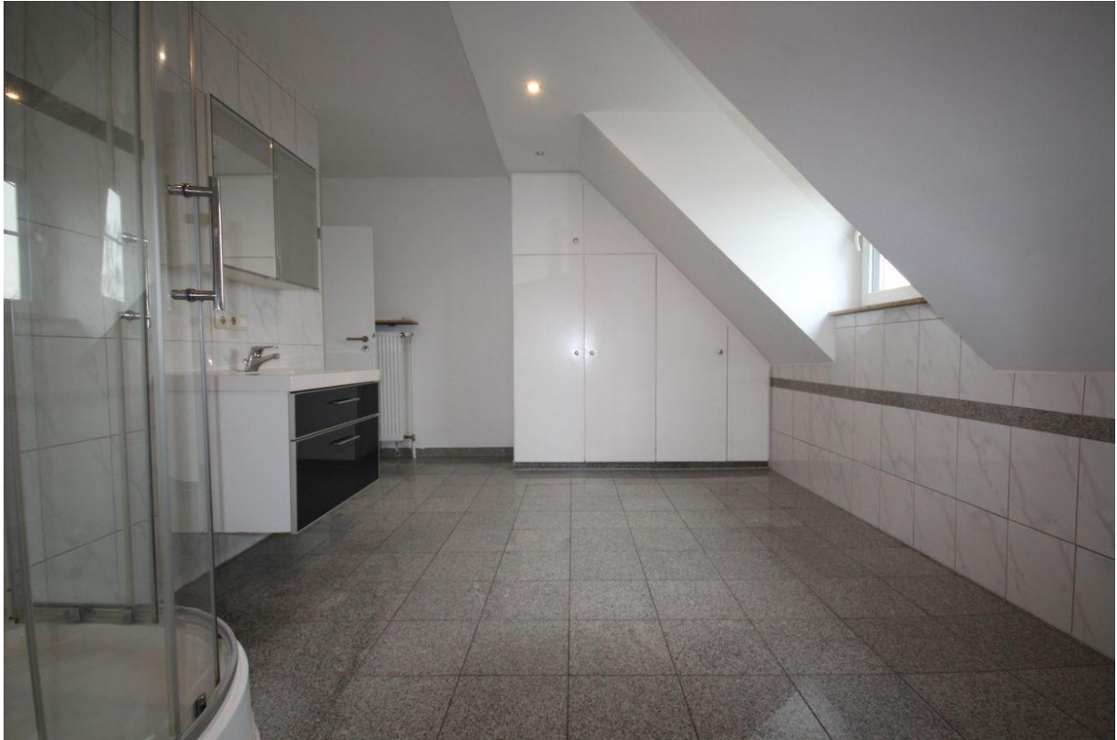
Wohnung im DG