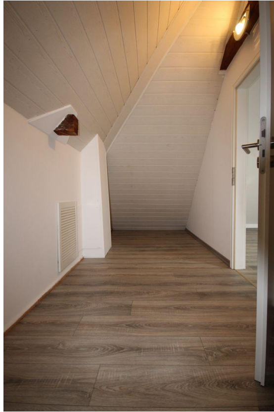
Wohnung im DG