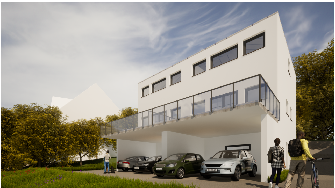
Süd - Ost