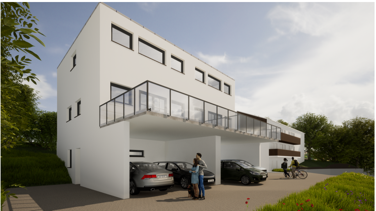
Süd - West