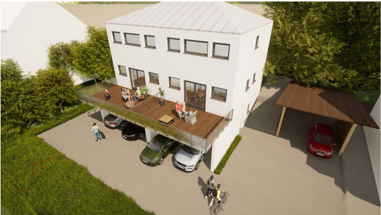
Süd - Ost