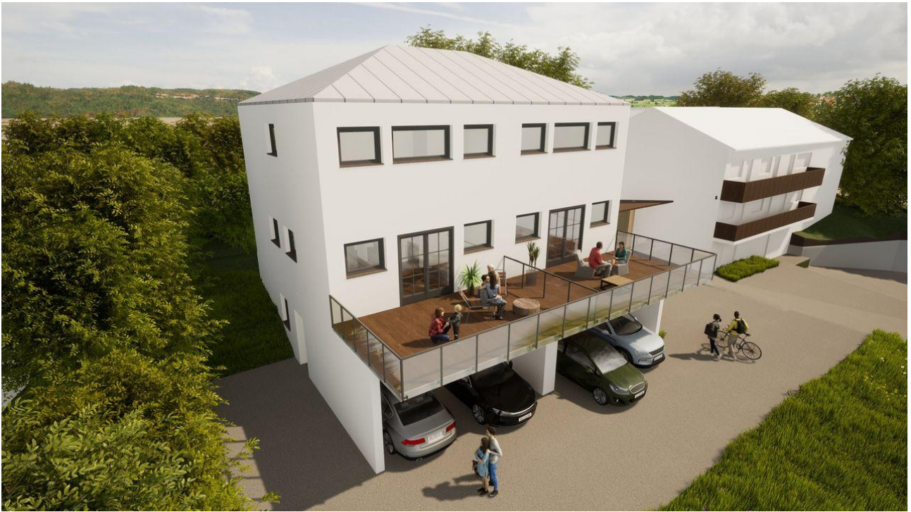
Süd - West