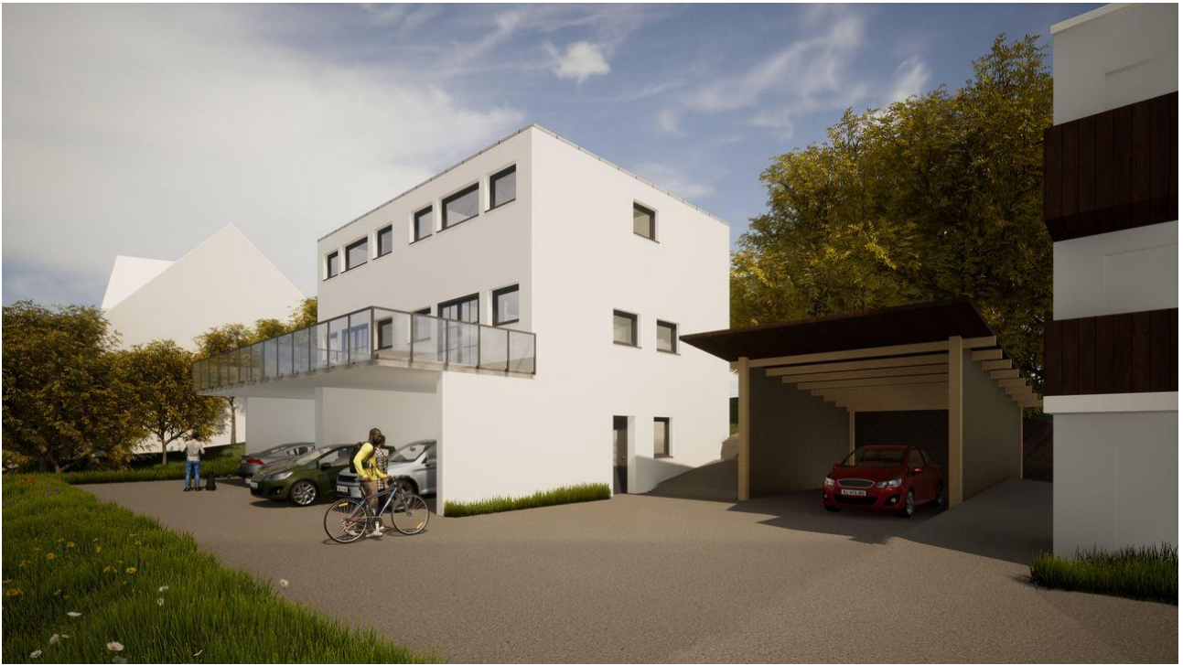
Süd - Ost