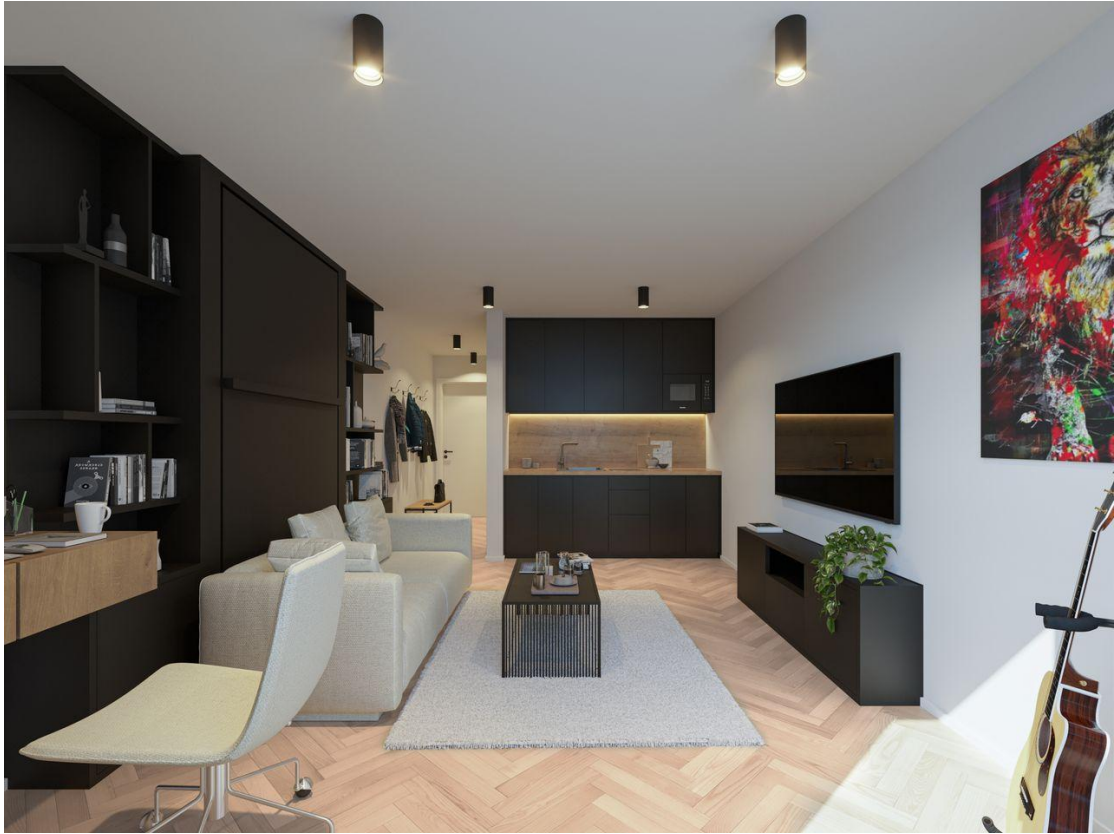
Microapartment Rend 1