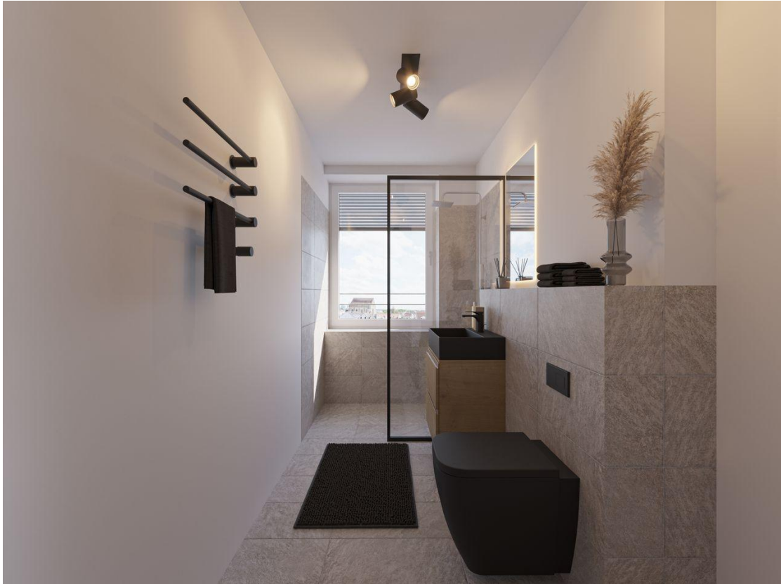
Microapartment Bad inkl. Fliesenrückwand