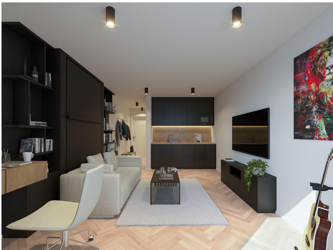
Microapartment Rend 1