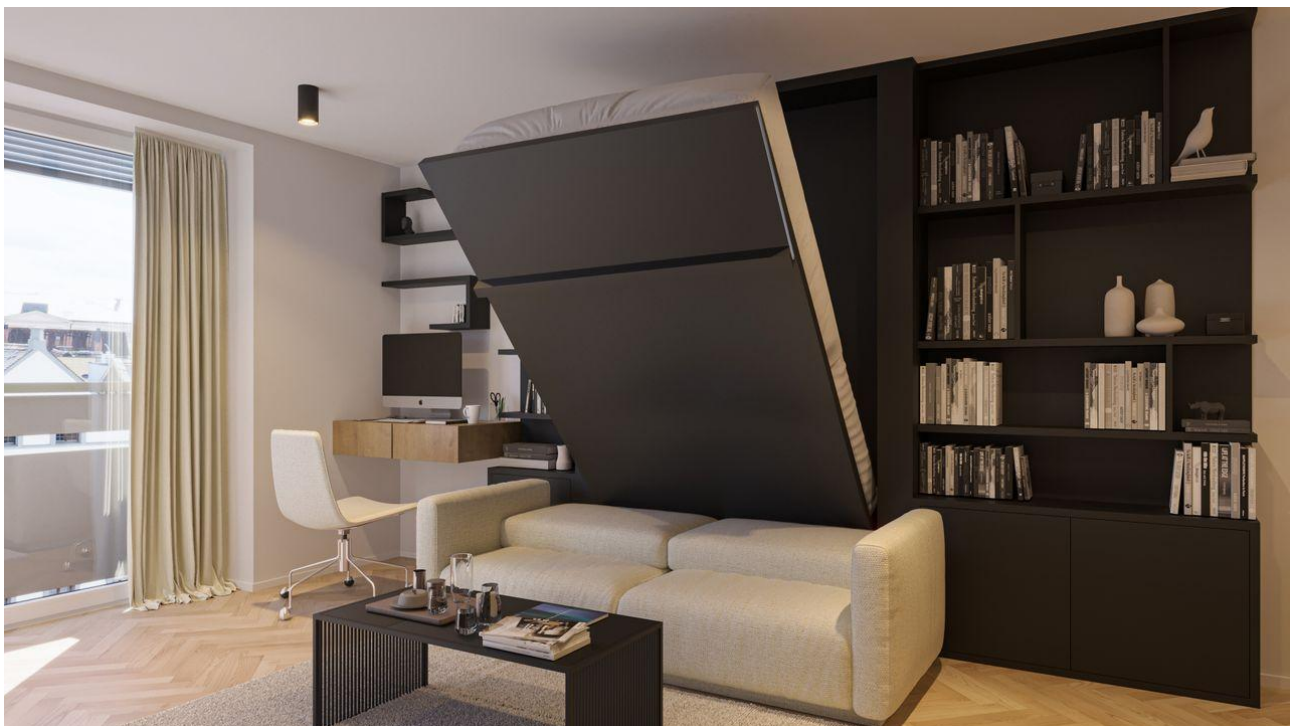
Microapartment RendV3 Ausklappfunktion