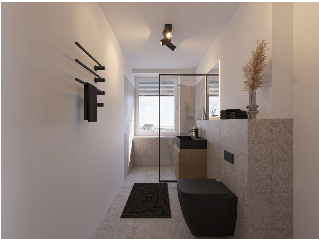
Microapartment Bad inkl. Fliesenrückwand