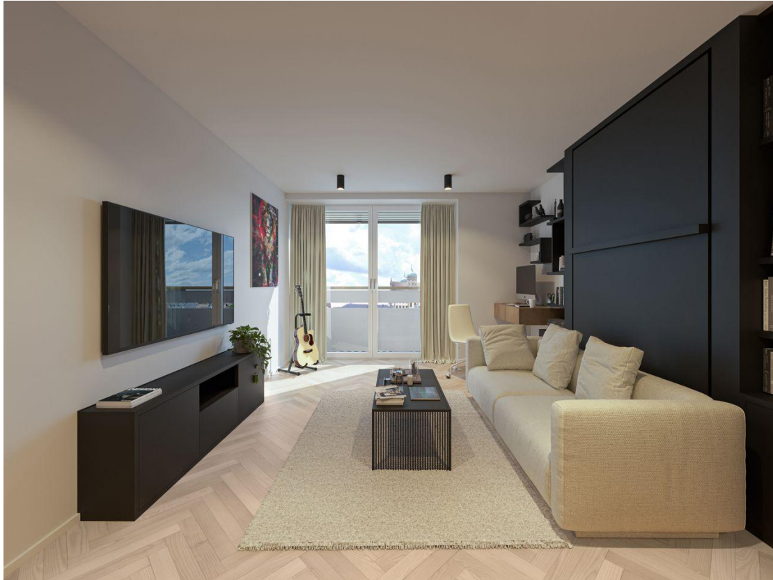
Microapartment Rend 2