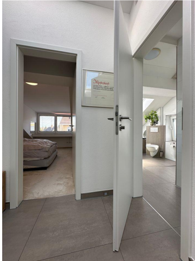
Zugang zu den Räumen