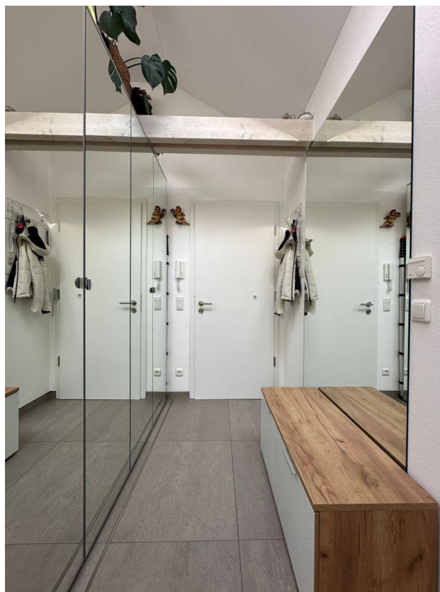
Flur und Eingang