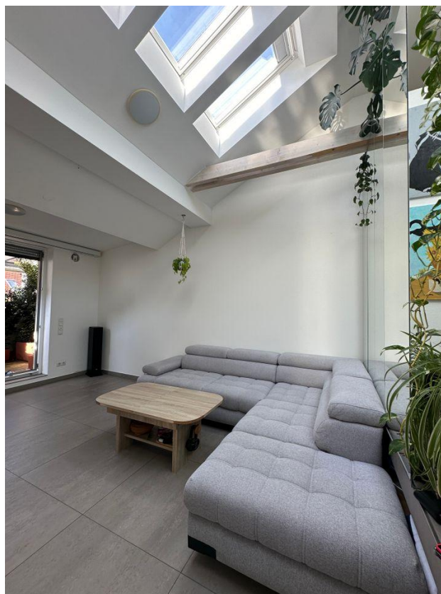
Hohe, helle Decken