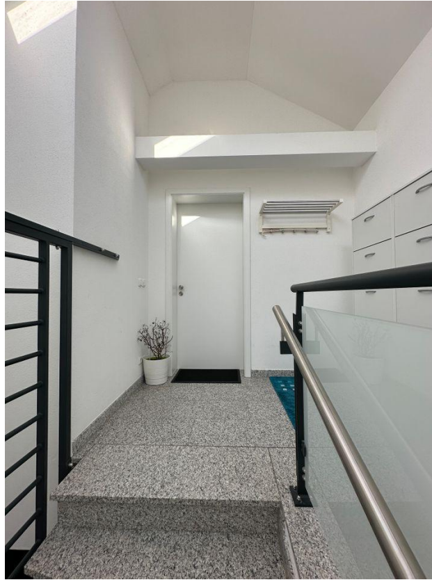
Eingang zur Wohnung